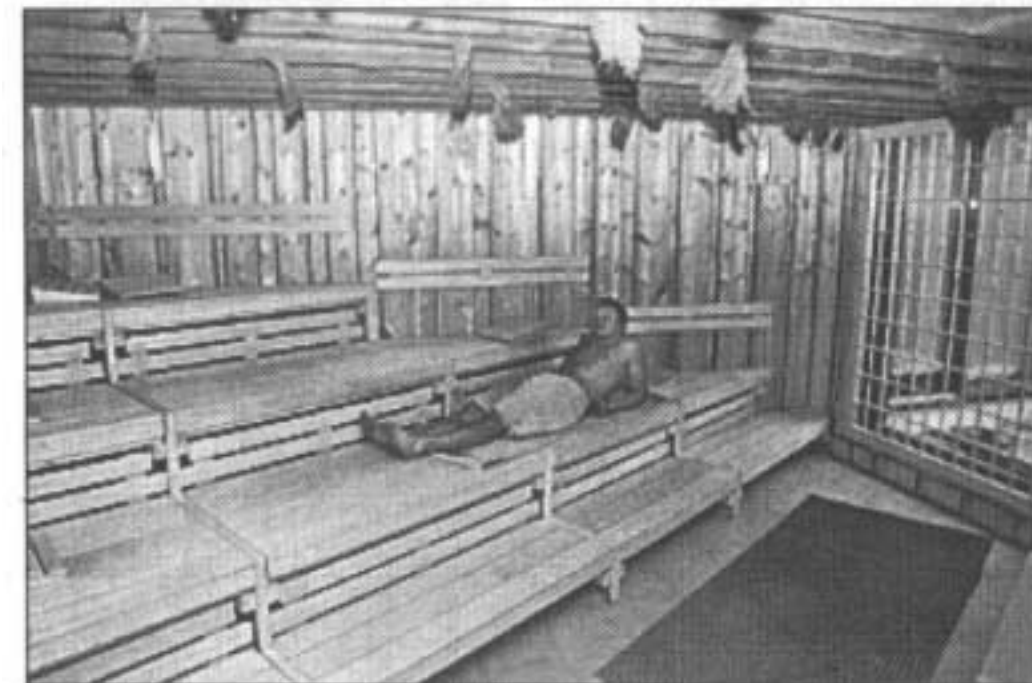
Zum Entspannen beim Schwitzen laden die unterschiedlichen Saunen im japanischen Stil ein.