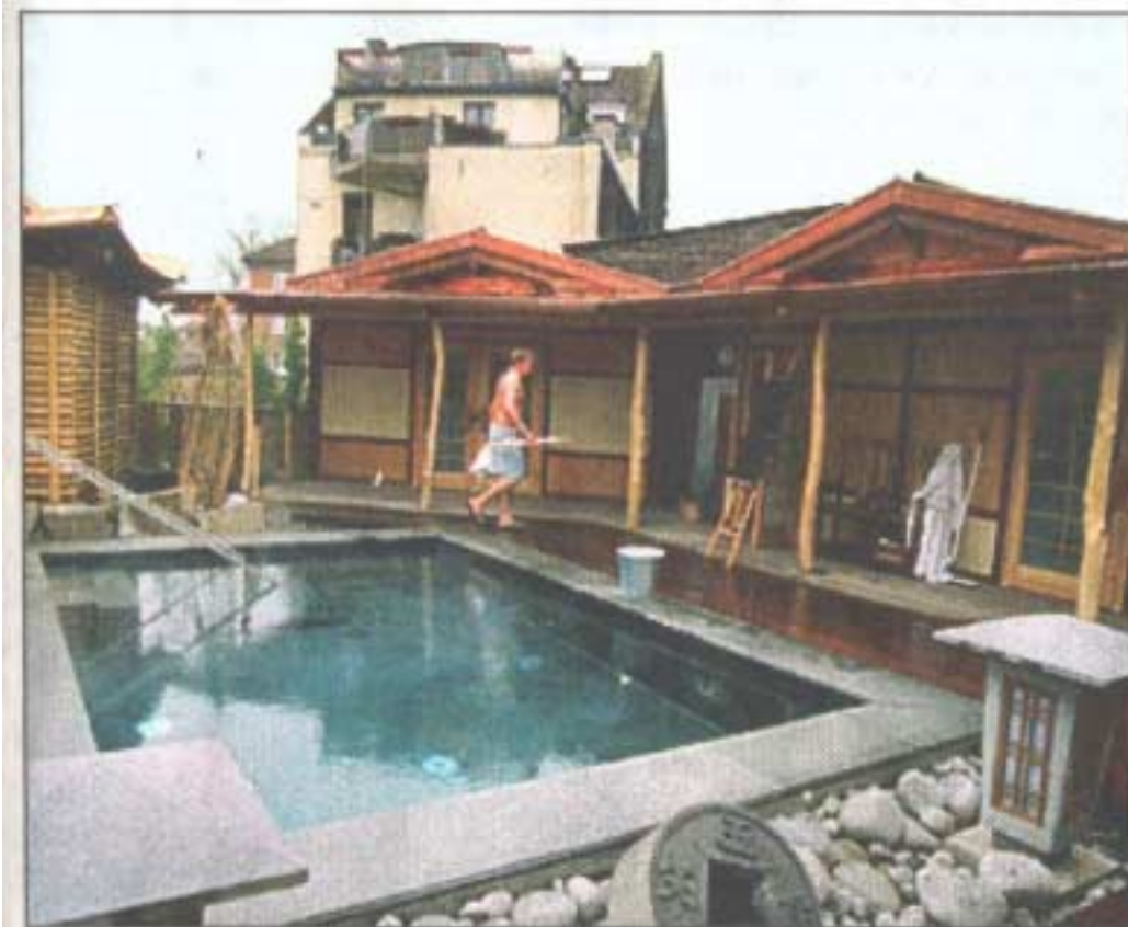
Erholsame Aufgüsse mit japanischen Saunaritualen gibt es auch in den Saunen im Außenbereich.