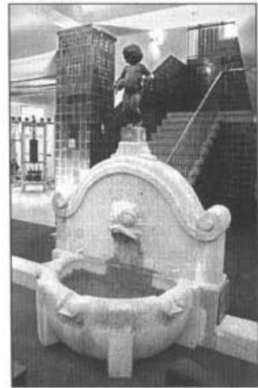
Der Neptunbrunnen ist erhalten geblieben.

„Neptunbad Health Club & Spa“ feiert in Ehrenfeld Eröffnung – Moderner Trainingsbereich und asiatische Saunalandschaft