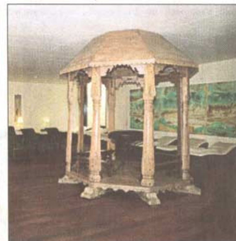
Zum Entspannen bieten sich die japanischen Onsenbäder (Bild links) und die großzügigen und stilvoll eingerichteten Ruhezonen an.