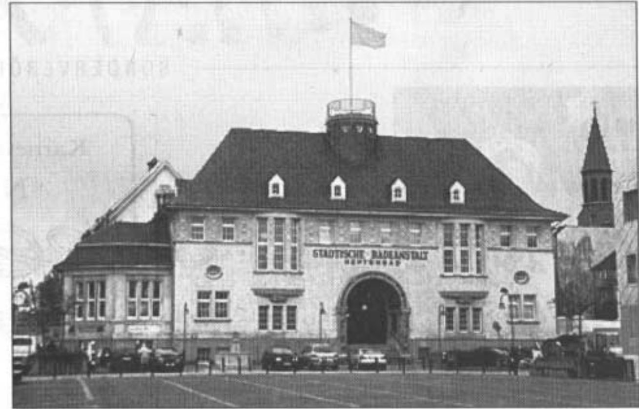
Das altherwürdige Neptunbad in Ehrenfeld ist jetzt ein Mekka für Fitness- und Wellness-Freunde. Zwei Jahre lang wurde das denkmalgeschützte Jugendstilgebäude umgebaut.

Wer durch das Training noch nicht genug ins Schwitzen gekommen ist, dem steht ein umfangreiches Wellness-Angebot zur Verfügung. Zur Entspannung laden auch die rekonstruierten historischen Schwitzbäder und der Pool mit meditativer Unterwassermusik ein. In diesem Bereich konnten trotz